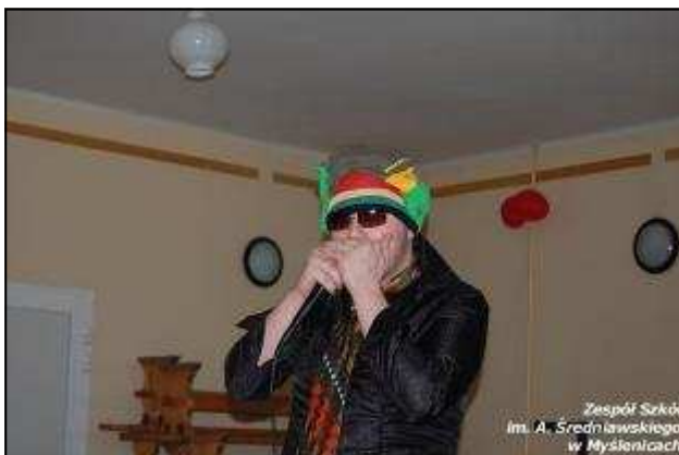
Zespół Szkół Im. A. Średniawskiego w Myslenicach